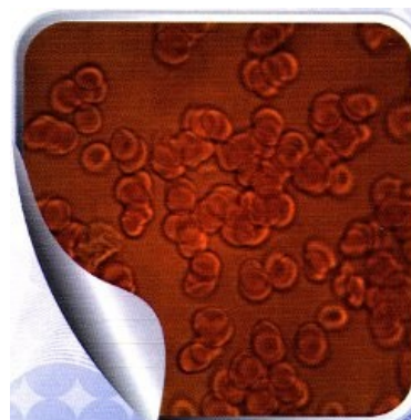
Рис. 2. Картина крови после применения КФС

Если с лечебной целью применить Корректор Функционального Состояния непосредственно или выпить воды, структурированной на приборе определенного номера, то наглядная картина меняется (рис. 2). Монетные столбики распадаются, эритроциты лучше усваивают кислород и поставляют его заинтересованным органам. Организм приободряется, а человек чувствует улучшение самочувствия. Так подтверждается работа Корректора Функционального Состояния непосредственно в момент применения.