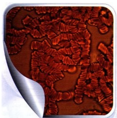
Рис. 1. Картина крови до применения КФС